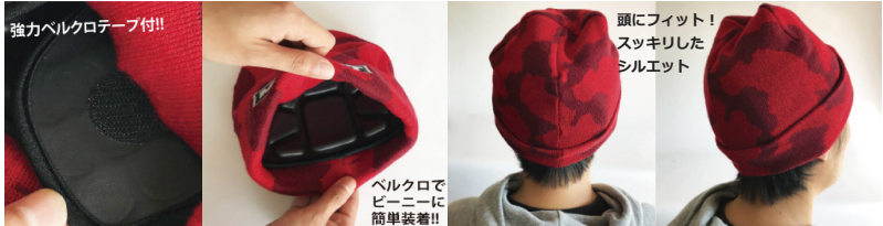
強力ベルクロテープ付!!

EVAをモールド成形した頭部用のプロテクターです。EVA素材とは、柔らかく弾力があり、衝撃吸収力は抜群。非常に軽量で、風雨や紫外線を浴びても劣化しにくく、耐久性に優れている上、ダイオキシンを発生しない無公害の環境に優しい素材です。